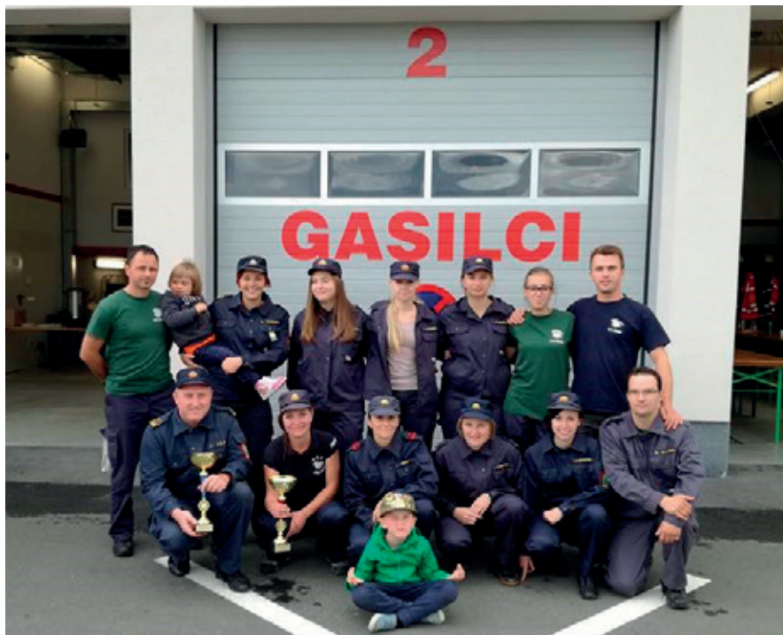
Tekmovanje GZ Videm, I. mesto za člane A in članice A, Podlehnik 3.9.2017

delovali na naslednjih proslavah in prireditvah: