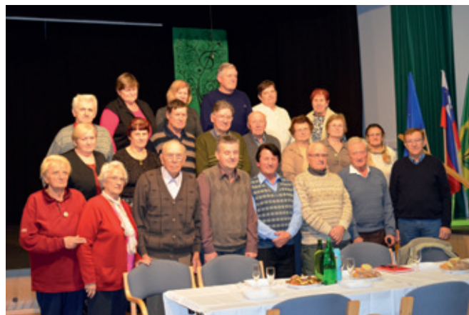
Člani Upravnega odbora, Nadzornega odbora in častnega razsodišča DU Žetale na zadnji seji v l.2017

DU Žetale bo ob svoji 25-letnici izdalo zbornik, v katerem bo predstavljeno delo društva v preteklem obdobju.