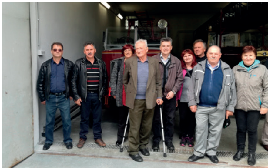
Veterani PGD Žetale na obisku v gasilski brigadi Ljubljana 22.4.2017