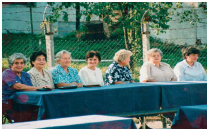
Pevke DU Žetale na otvoritvi prvega javnega vodovoda v občini Žetale leta 2000