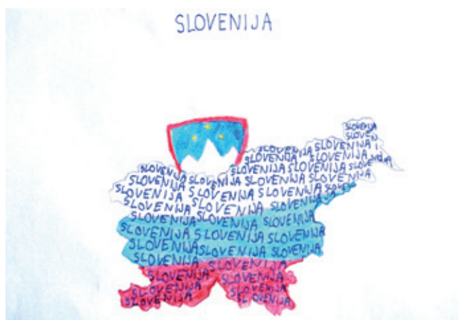
Likovna pesem, Uroš Ber, 9. razred