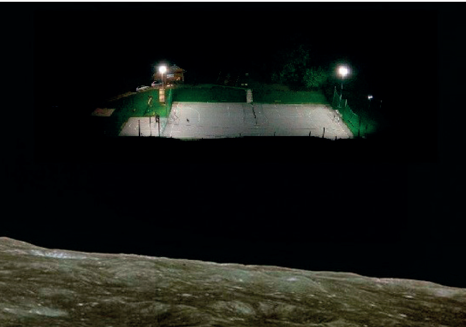
»Pogled iz lune« na športni park Rim

Jesenski dnevi prinašajo nova opravila in naloge in nič drugače ni bilo v Športnem društvu Rim. 23. 9. 2017 so se uresničile dolgoletne sanje in želje članov ter simpatizerjev športnega društva. Na ta dan so namreč 'grabo' razsvetlili reflektorji. Športni park sedaj razsvetljuje 10 LED reflektorjev, ki so postavljeni na štirih kandelabrih. Investicija v razsvetljavo je potekala v obdobju zadnjih dveh let, pokrita pa je bila izključno iz lastnega proračuna, na kar smo še posebej ponosni. Ob tej priložnosti bi se zahvalili vsem občanom in občankam občine Žetale, ki prispevate prostovoljne prispevke, ko vas obiščemo s koledarji v mesecu decembru. Ti prispevki tvorijo pomemben delež proračuna ŠD Rim. Najlepša hvala. Občina Žetale je s tem dobila še en prostor, kjer je rekreacija mogoča tudi po tem, ko sonce že pade za Donačko. Jesenski dnevi sedaj niso več tako kratki.